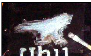
Schablone an den Ecken festkleben und ausmalen